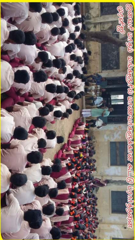
ஐனவரி மாதம் மஸ்கூனூரில் மானவர்களுக்கான கூட்டுப் பரவர்த்தனை முரளிஜி