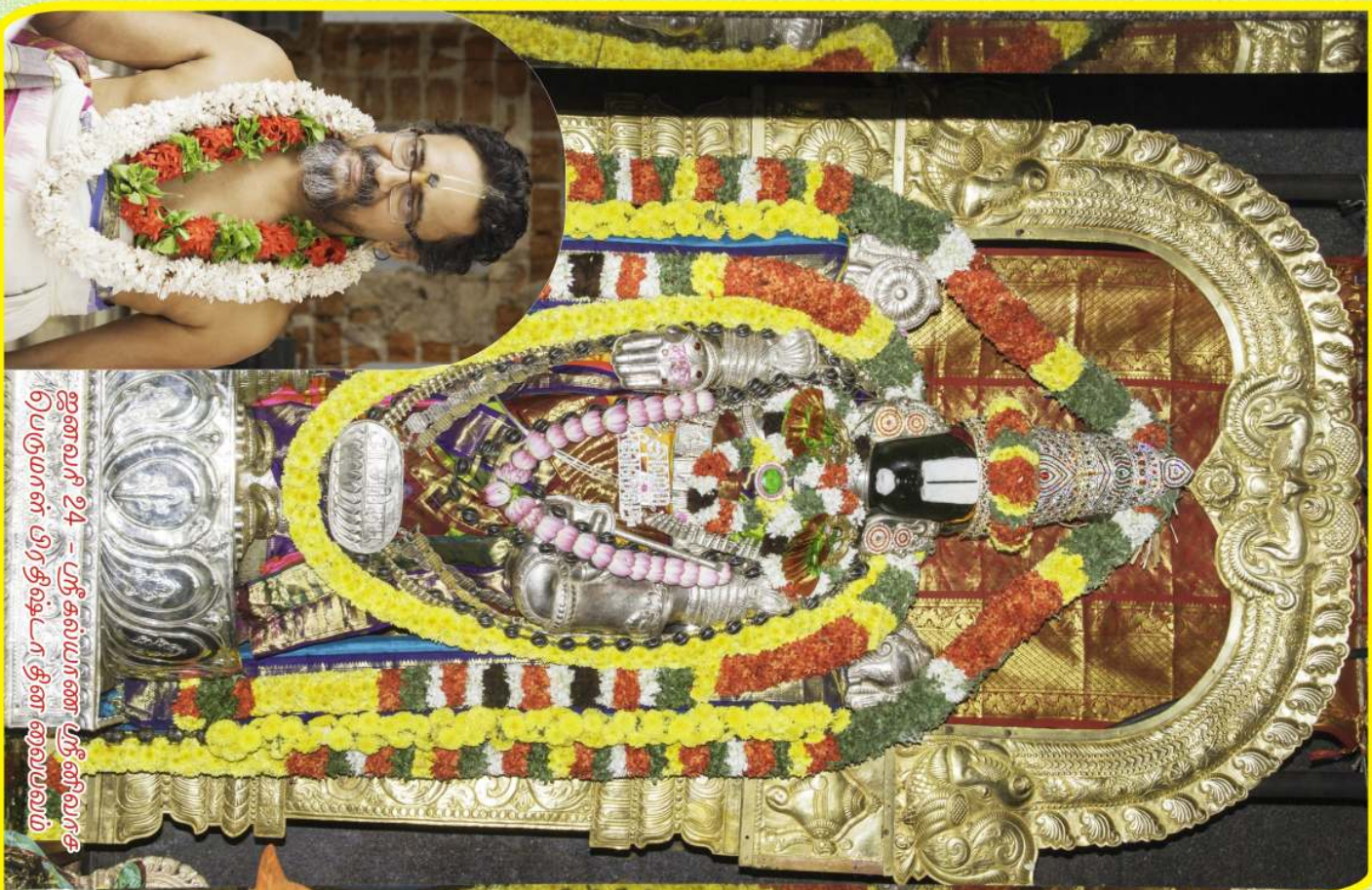
ஐனவரி 24 - பீக் கல்யாணை பீனீலிராக பெருமாள் பிரதிஷ்டை தின வைபவம்