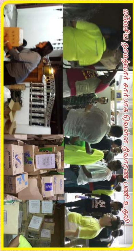
மலேசியா டிரைவர்கள் சார்பாக வெள்ள தீவிரண பணி உதவி