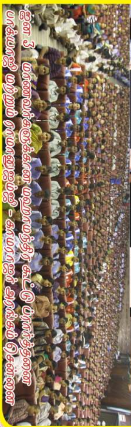
ஐன 3 மாணவர்களை அழைத்துக் கூட்டு மாணவர்களை பரிசு வழங்கி மற்றும் ராமாஜாஜி - காமராஜர் அரங்கம் சென்னை