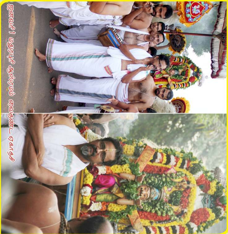
ஐனவரி 1 மதுரபுரி ஆஸ்பிரயம் வைகுண்ட ஏகாதசி