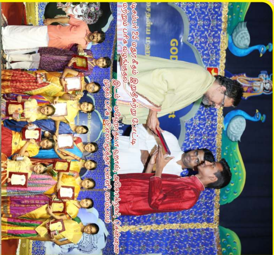
முதல் பரிசு வழங்குதல் இடம் - மலேசியா ஹால், அனோந்தன், சென்னை டிசம்பர் 25 மதுரை இறுதி கற்று போட்டி மற்றும் பரிசு வழங்குதல்